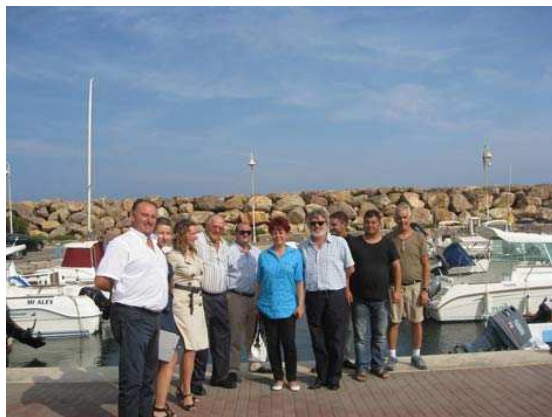
Imagen de la visita

El delegado de Agricultura y Pesca espera que el intercambio de experiencias abra una línea de cooperación entre los Grupos de Desarrollo europeos